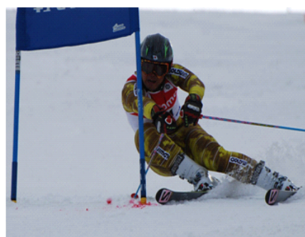
〔スキー部（アルペン）〕

文化部では吹奏楽部が各地で活発に演奏会を開き、社会科クラブはボランティア活動が高く評価されて、14年連続でボランティアスピリット賞を受賞し、書道部は全国レベルでの活躍もあります。