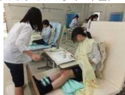
<「生活と福祉」の授業>

☆ 私は新井高校とても充実した日々を過ごすことができました。新井高校は総合学科であるため、科目選択が自由で、様々な進路選択をすることができます。自分に合った勉強、自分の好きな勉強をすることができますとところが魅力だと思います。普通科では学べない授業もあり、その後の進路に役立てて選択肢を広げることができます。部活動も盛んで、私は運動部に所属し、最高の仲間を得て、最後まであきらめないことの大切さを学ことができました。熱心に指導してくださる先生方がたくさんいて、とても心強いです。その様な整った環境の中で、頼もしい仲間たちと共に勉強や部活に励み、様々な学校行事を思い切り楽しめる新井高校で是非素敵な高校生活を送ってください。(卒業生)