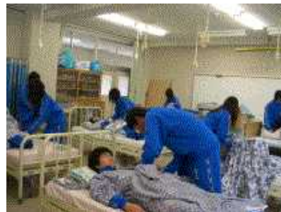
<「生活と福祉」の授業>

☆ 私は新井高校とても充実した日々を過ごすことができました。新井高校は総合学科であるため、科目選択が自由で、様々な進路選択をすることができます。自分に合った勉強、自分の好きな勉強をすることができますとところが魅力だと思います。普通科では学べない授業もあり、その後の進路に役立てて選択肢を広げることができます。部活動も盛んで、私は運動部に所属し、最高の仲間を得て、最後まであきらめないことの大切さを学ことができました。熱心に指導してく